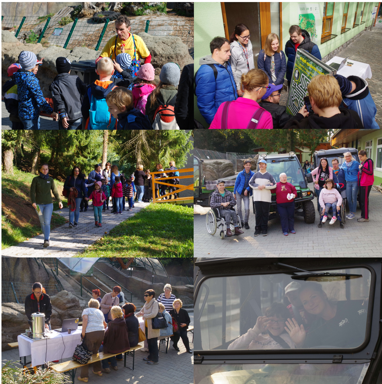
Foto vľavo: Zo scény s klaunom. Foto vpravo: Netradičné komentované prehliadky účastníkov zaujali.

Horný rad: Aktivity na stanoviskách podujatia Dr. Klaun s deťmi objavuje Bojnice.