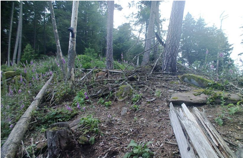
Záber z fotopasce.

Foto hore: Mláďa rysa narodené v Nemecku.