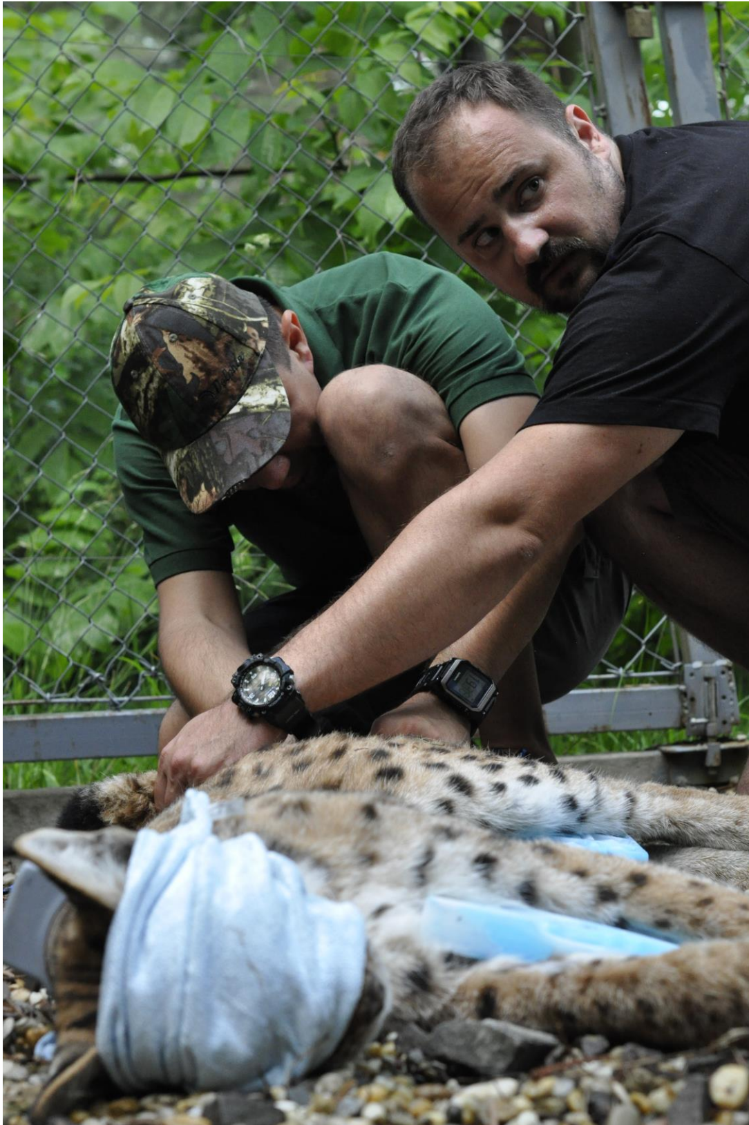
Fotografia: Meranie základných fyziologických funkcií imobilizovaného rysa.