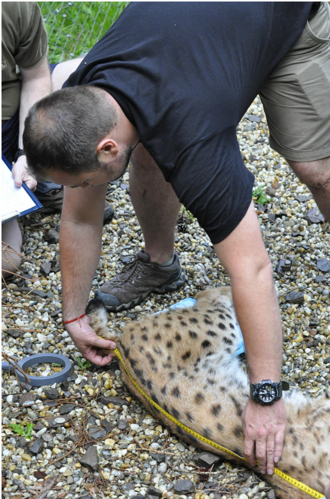
Fotografia: Zaznamenávanie telesných mier pred transportom.