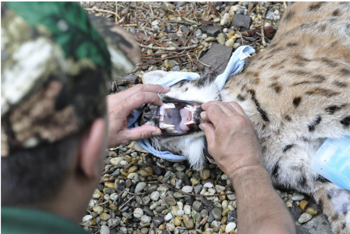
Fotografia: Prehliadka zdravotného stavu dvojročného rysieho samca pred transportom.

Titulná fotografia (hore): Braňo po vypustení vo Falckom lese.