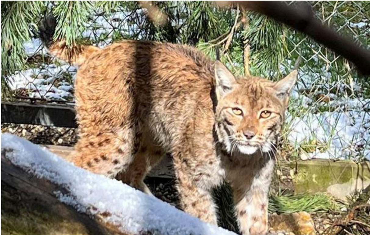
Rysia samica v rehabilitačnej stanici Nzoo Bojnice.